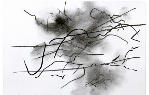
松 デッサン 2020、氷川神社 7