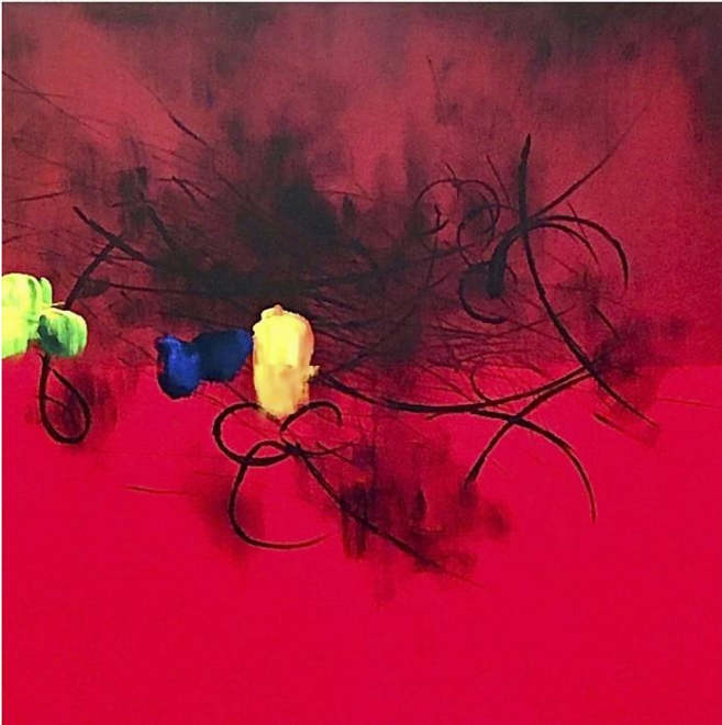
Another Nature(red)2021 キャンバスに墨と絵具