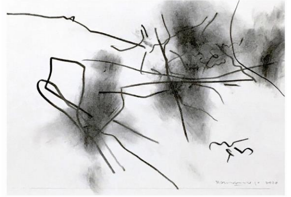
松 デッサン 2020、氷川神社 5