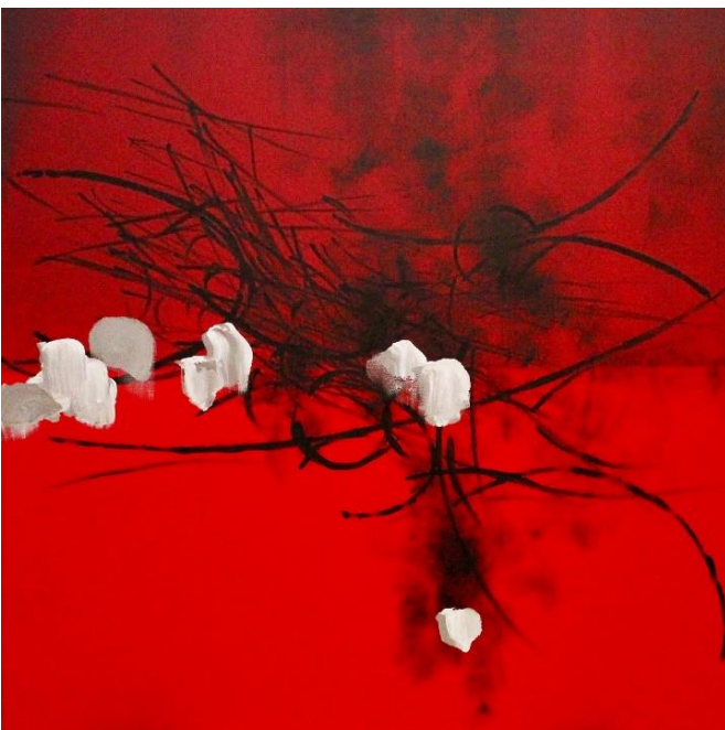
Another Nature(red)2019 キャンバスに墨と絵具