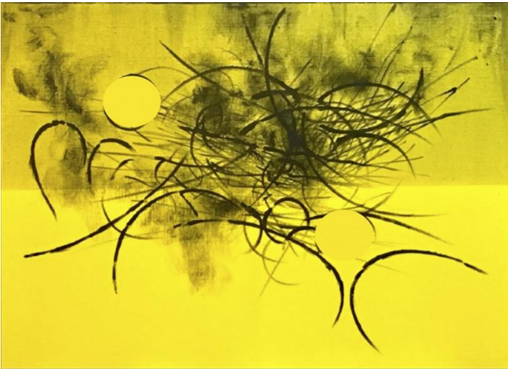
Another Nature(yellow)2019_2021 キャンバスに墨と絵具