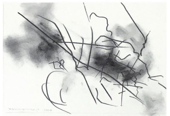
松 デッサン 2020、氷川神社 2