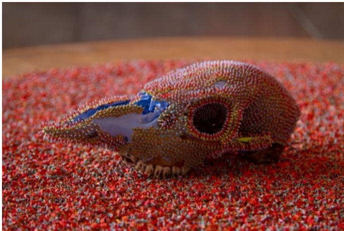
Rinzu(鱗頭-剥奪・把捉・反省感覚・戯れ-)skull,oily ink 2010