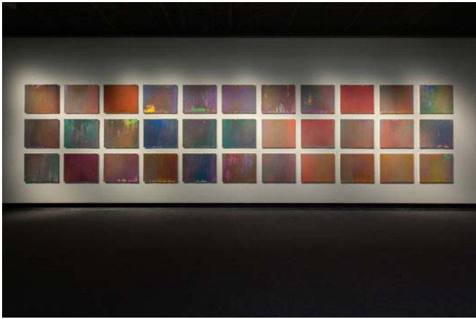
Hundred Layers of Colors 75×90cm×33pieces silkscreen 2014